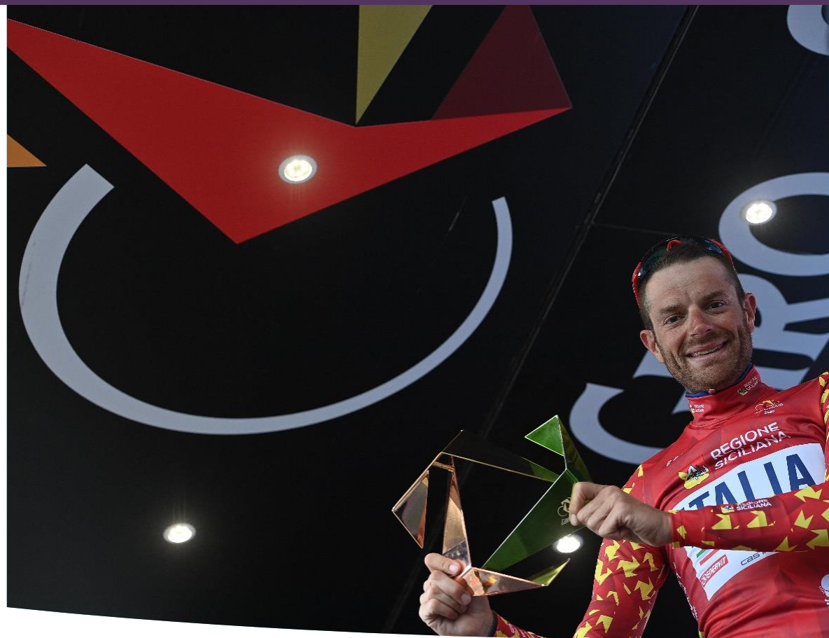
DAMIANO CARUSO WINNER 2022

Announced, among the riders, the winner of the last edition, Damiano Caruso.